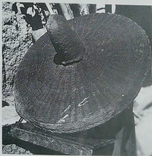
清代毕摩使用的箴制法帽